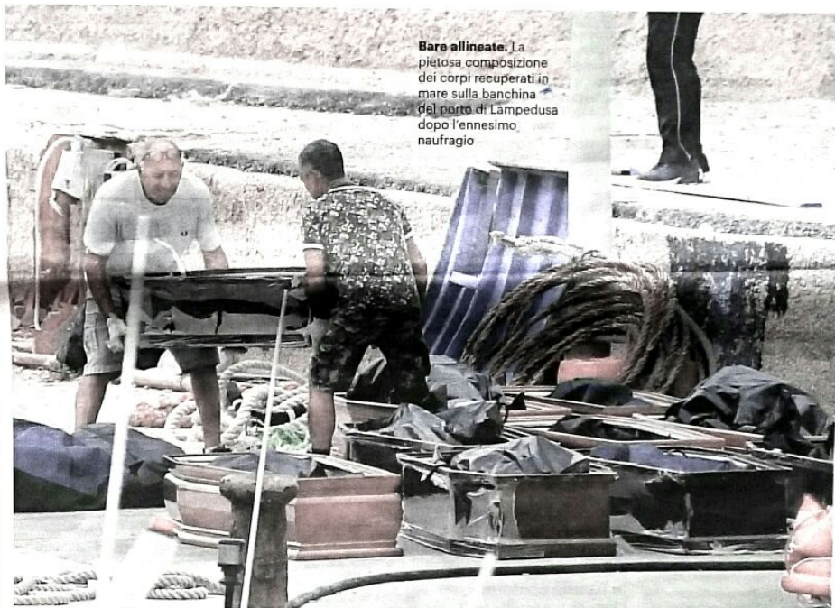
Bare allineate. La pietosa composizione dei corpi recuperati in mare sulla banchina del porto di Lampedusa dopo l'ennesimo naufragio